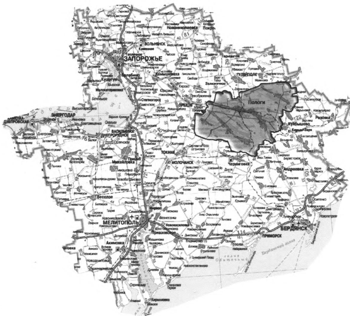
Рисунок. Географическое положение муниципального образования